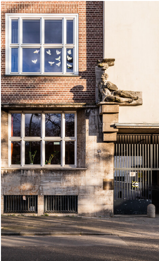
Gemeinschaftsgrundschule Garthestraße in Köln-Riehl (2022)