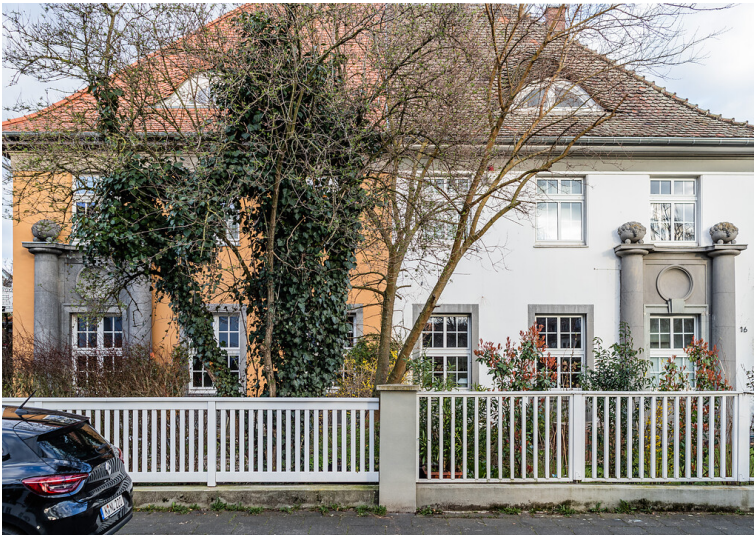
Villen für englische Besatzungssoldaten aus der Zeit um 1920 in Köln-Riehl (2022)