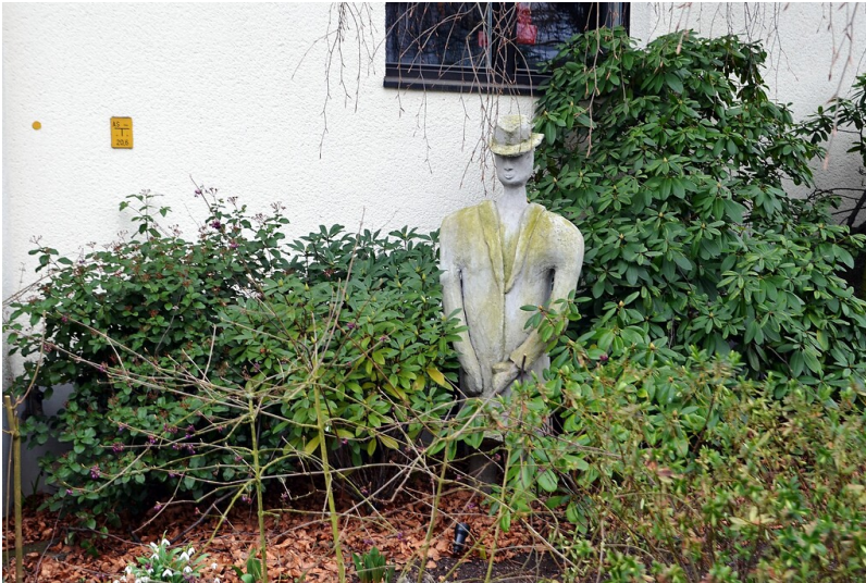
Die Betonskulptur „Der Frontmann“ in der Johannes-Müller-Straße in Köln-Riehl (2018).