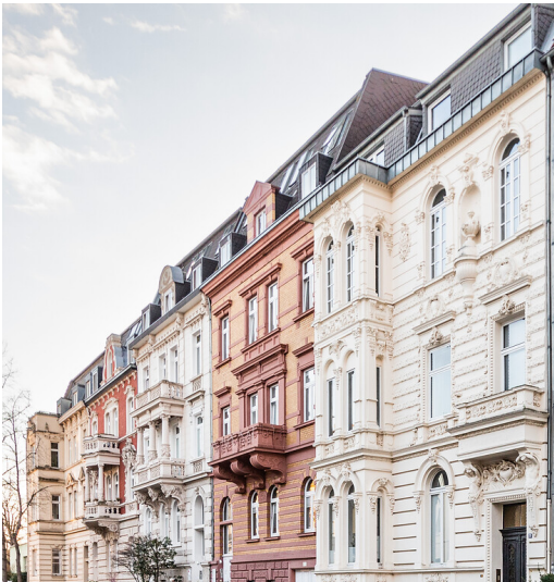
Häuserzeile in der Stammheimer Straße in Köln-Riehl (2022)