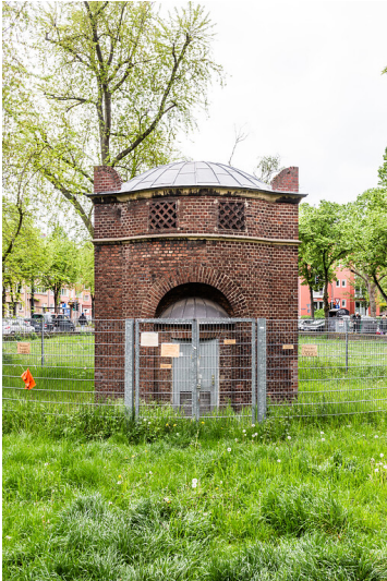
Transformatorenhäuschen in Köln-Sülz (2021)