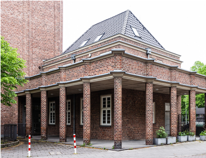
Ehemaliges Eingangs-, Verwaltungs- und Hausmeistergebäude der Theodor-Heuss-Realschule in Köln-Sülz (2021)