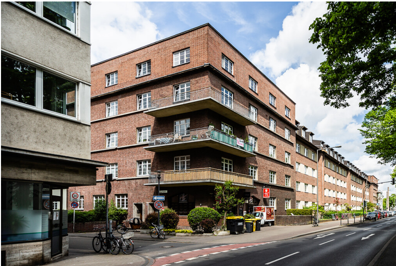
Hausecke des Wohnblocks "Zülpicher Hof" in Köln-Sülz (2021)