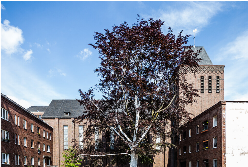
Kirche St. Borromäus in Köln-Sülz (2021)