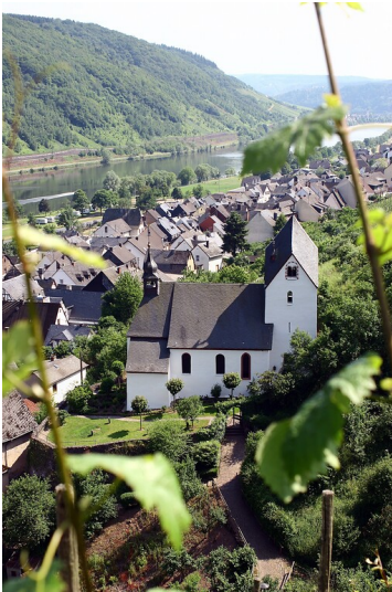
Alte Kirche und Dorf