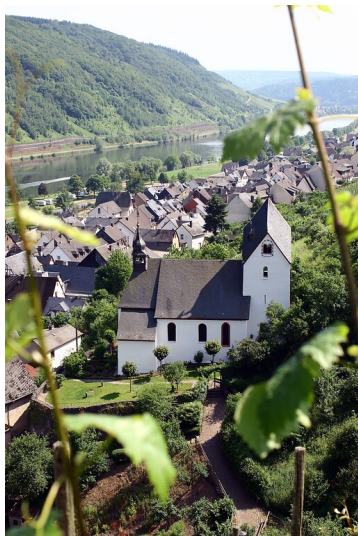
Alte Kirche und Dorf