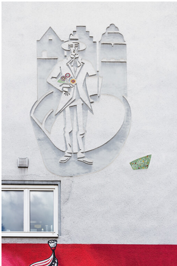
Maler-Bock-Sgraffito in Köln (2020)