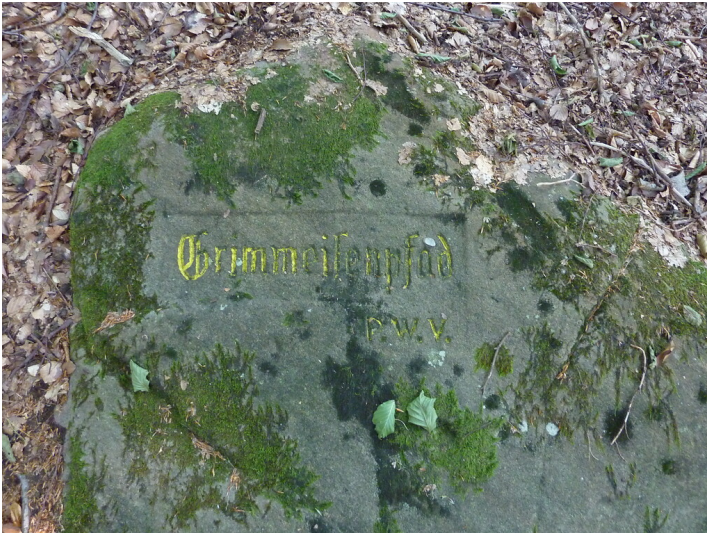
Ritterstein Nr. 184 Grimmeisenpfad nordöstlich von Rinnthal am Kehrenkopf (2013)