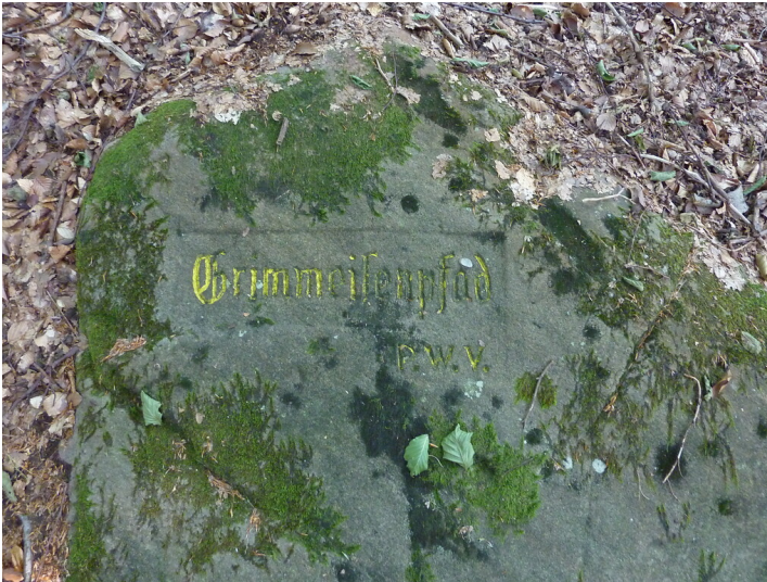
Ritterstein Nr. 184 Grimmeisenpfad nordöstlich von Rinntal am Kehrenkopf (2013)