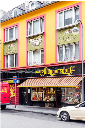
Honigbienen-Sgraffito in Köln (2020)