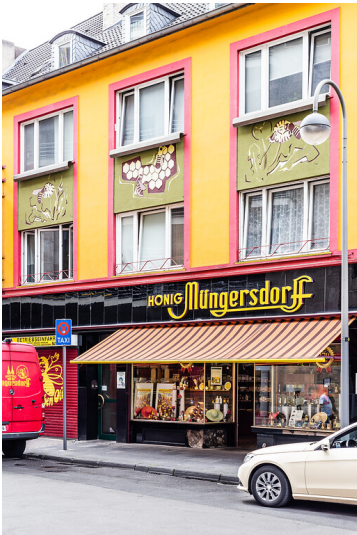
Honigbienen-Sgraffito in Köln (2020)