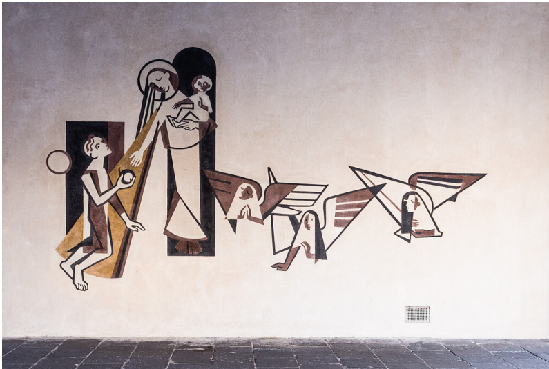
Sgraffito des heiligen Hermann Joseph an der Kölner Basilika St. Maria im Kapitol (2021).