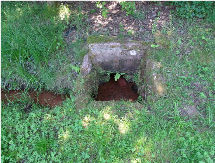
Ritterstein Nr. 182 St. Pirmansborn südlich von Spirkelbach (2020)