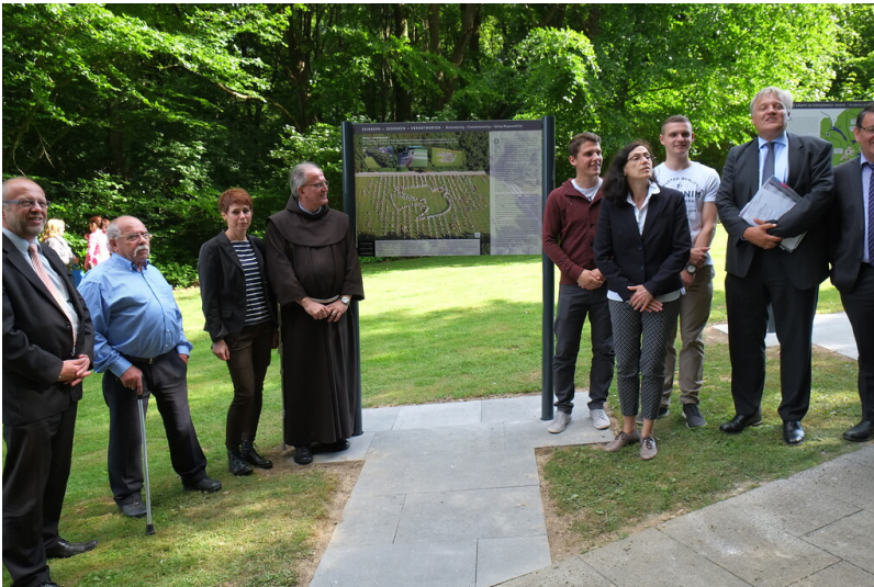
Bild 1: Sechs Stelltafeln auf der Kriegsgräberstätte Vossenack werden der Öffentlichkeit übergeben (10. Juni 2015).