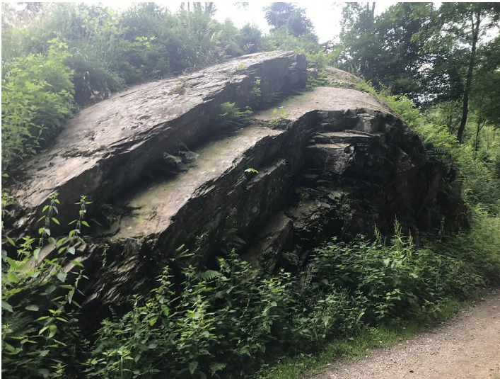
Geogogischer Sattel an der Teufels Ley im Kalltal bei Vossenack (2021).