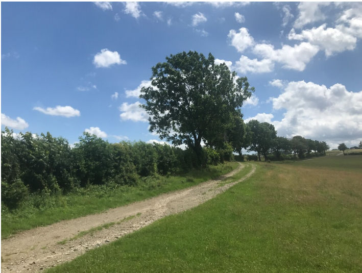
Wegbegleitende Windschutzhecke am Aussichtspunkt auf den Hürtgenwald bei Kommerscheidt (2021)