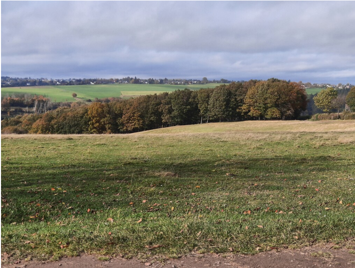
Blick über die Gavin-Wiese auf Vossenack (2021)