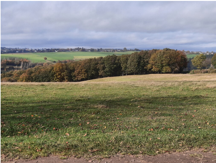
Blick über die Gavin-Wiese auf Vossenack (2021)