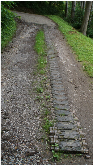
Die etwa 10 Meter lange Panzerkette stammt von einem Sherman-Panzer (2021)