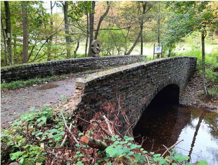
Kall-Brücke zwischen Vossenack und Kommerscheidt (2021)