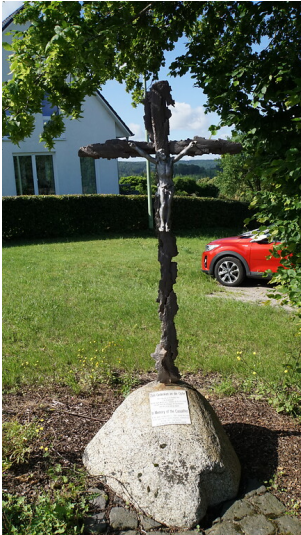
Das Splitterkreuz in Vossenack wurde 2005 aus Granatsplintern gefertigt und aufgestellt (2021).