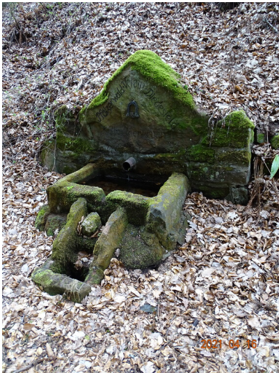
Katharinenbrunnen am Enggleisbach Diedesfeld (2021).