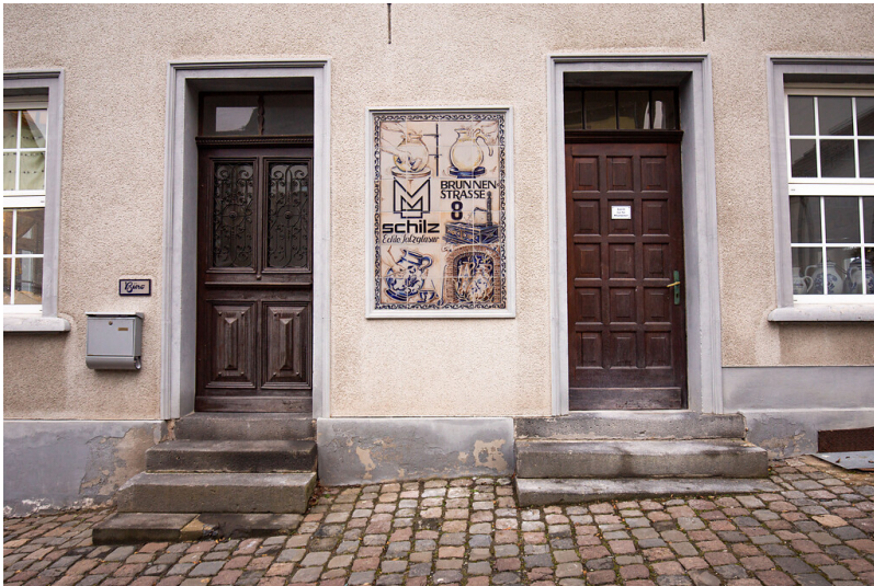
Eingang zur Töpferei Schilz in der Brunnenstraße 8 in Höhr-Grenzhausen (2020).