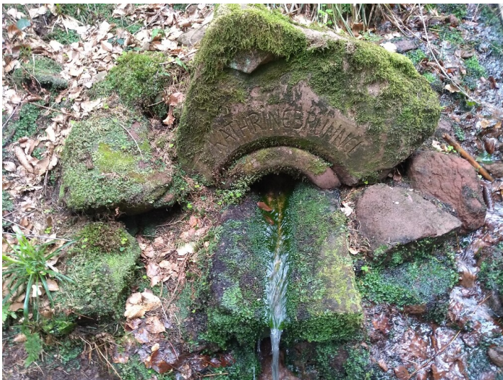
Katharinenbrunnen in Sankt Martin (2021).