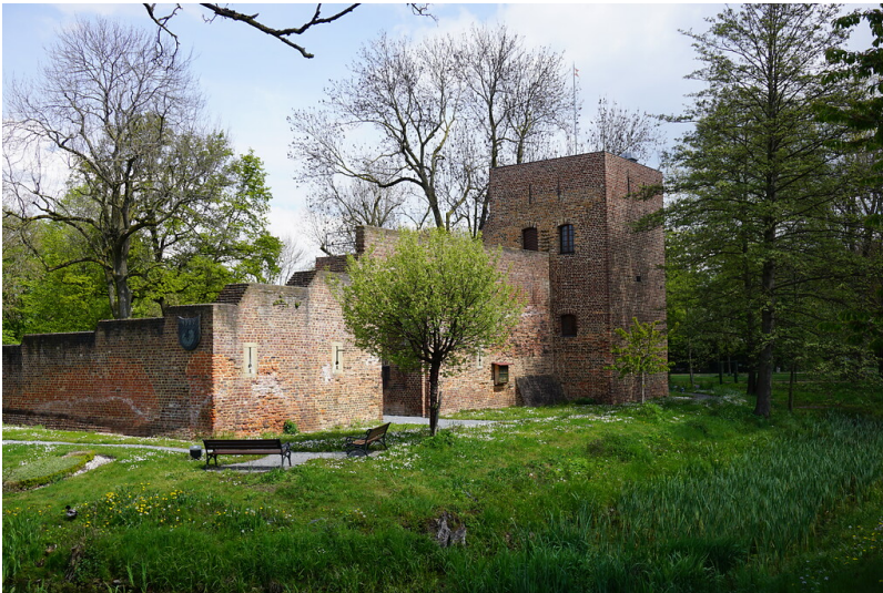
Neue Burg Hüls (2021)