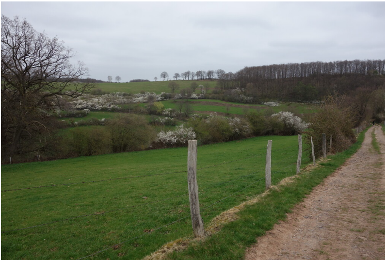
Ackerterrassen östlich von Heimbach-Hausen mit begleitenden Heckenstrukturen (2021).