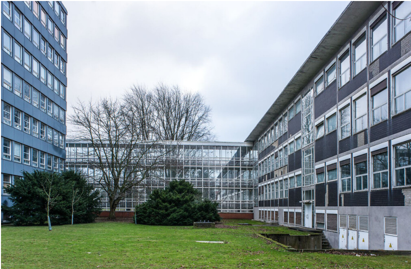
Verseidag Hauptverwaltung, Stadthaus Krefeld (2020)