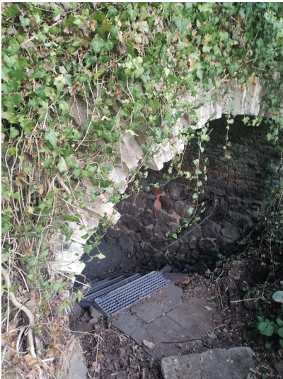
Tunnelabschnitt für die Dieselloks an der Straße „Zum Steinbruch“, nahe des Dattenberger Steinbruchs (2020).