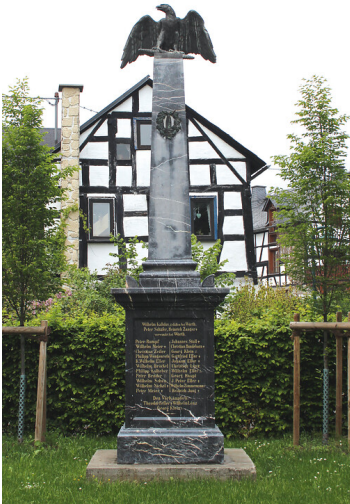
Kriegerdenkmal in Schupbach (2019)