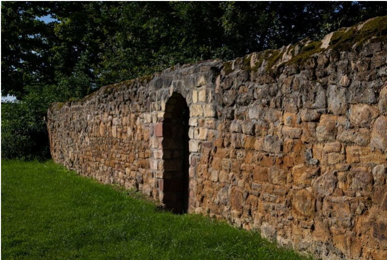
Historische Dorfmauer Dortelweil (2021)