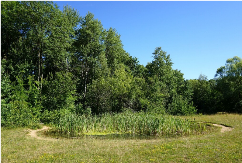
Biotop am Alten Schießplatz im Bad Vilbeler Stadtwald (2019)