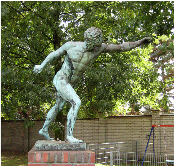
Die einen olympischen Sportler darstellende Bronzefigur an der Krefelder Hubert-Houben Kampfbahn (2007), das Werk entstand 1905 in der Düsseldorfer Werkstätte "Bronzeguss Förster-Kracht".