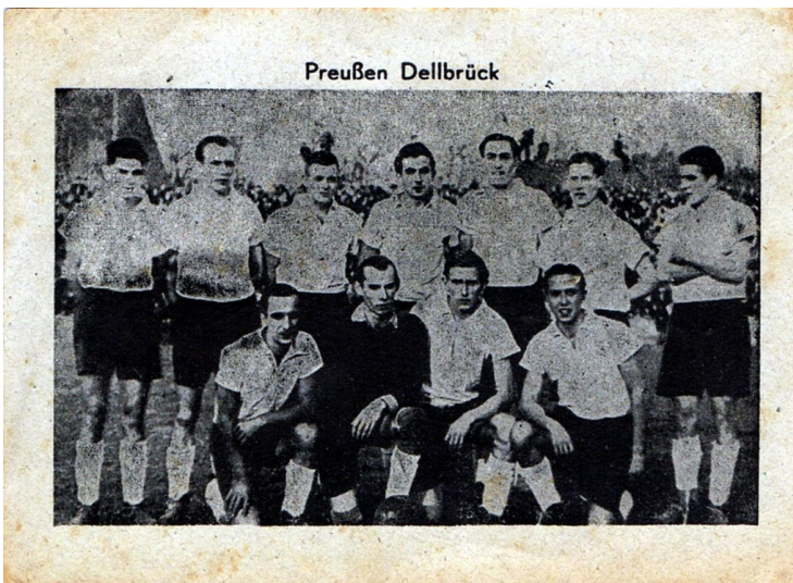
Historische Postkarte "Preußen Dellbrück" (undatiert).