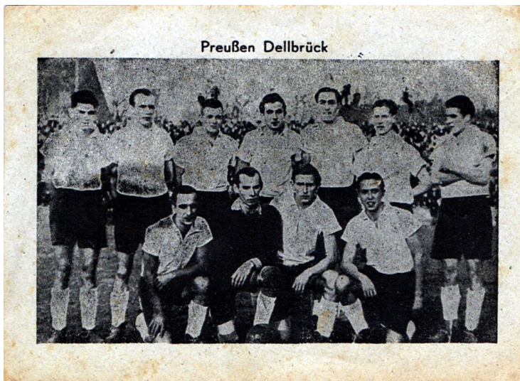
Historische Postkarte "Preußen Dellbrück" (undatiert).