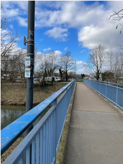
Der Festplatzsteg in Bad Vilbel (2023)