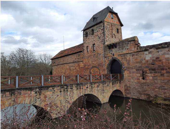
Burg Vilbel im Burgpark Bad Vilbel (2021)