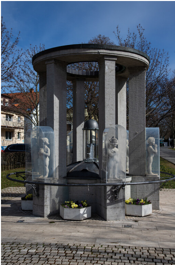
Brunnen am Römermosaik in Bad Vilbel (2021)