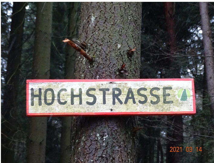
Hochstraße (Heldenstein-Taubensuhl) (2021)