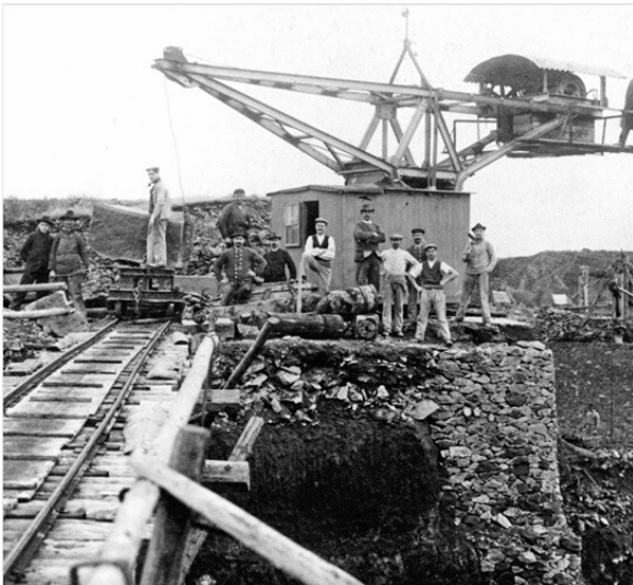
Früher Grubenkran mit Elektromotor (um 1905).