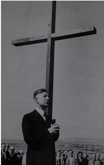
Kreuzerrichtung und Namensgebung des Stadtteils Heilsberg am 9. Juni 1948