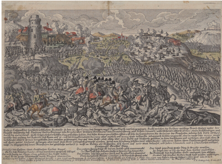
Kolorierter Kupferstich der Schlacht zu Bergen und Vilbel 1759 Fotograf/Urheber: Josef Erasmus Belling