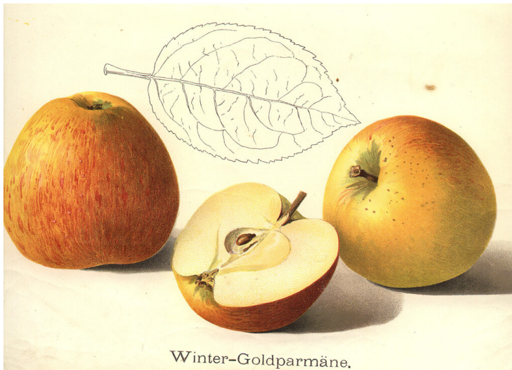
Goldparmäne (Zeichnung 1911)