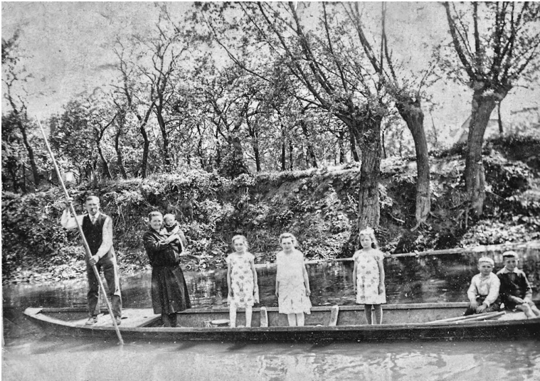
Familien-Partie auf der Nidda (1929)