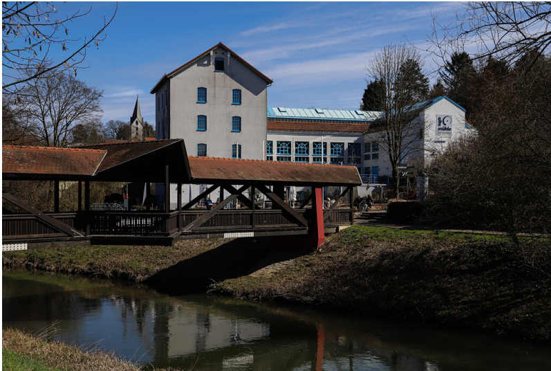
Alte Mühle in Bad Vilbel (2021)