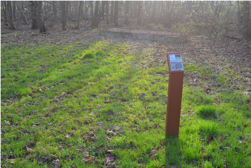
Erzählstation "Worringer Stollen" (2015)