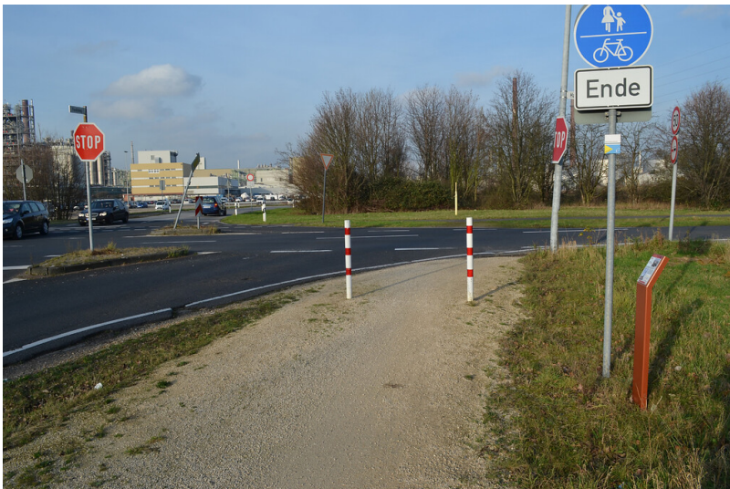
Erzählstation "INEOS Kraftwerk" (2015)