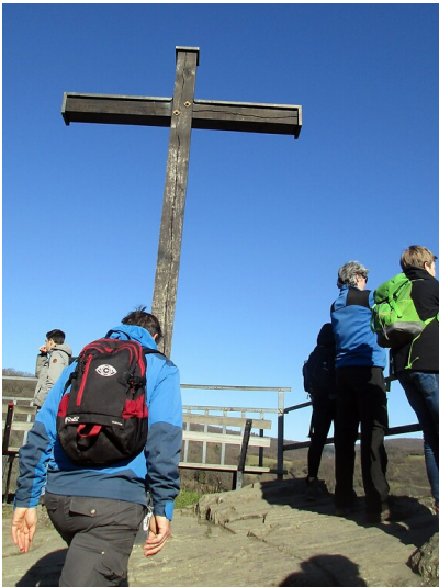
Der Aussichtspunkt "Schwarzes Kreuz" oberhalb des Ortes Altenahr im Landkreis Ahrweiler (2021).