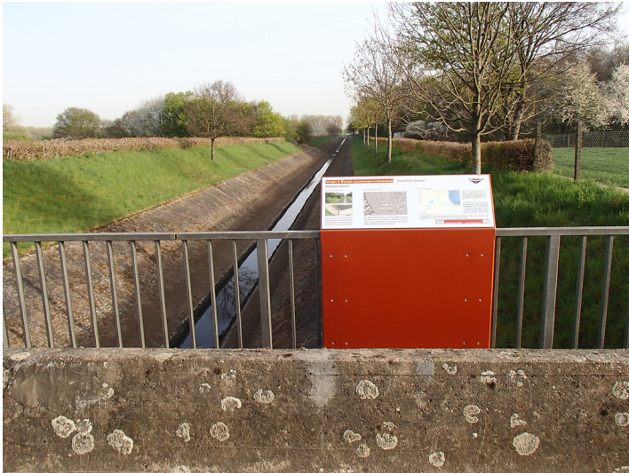
Erzählstation "Pletschbach" am Kölner Randkanal (2018)