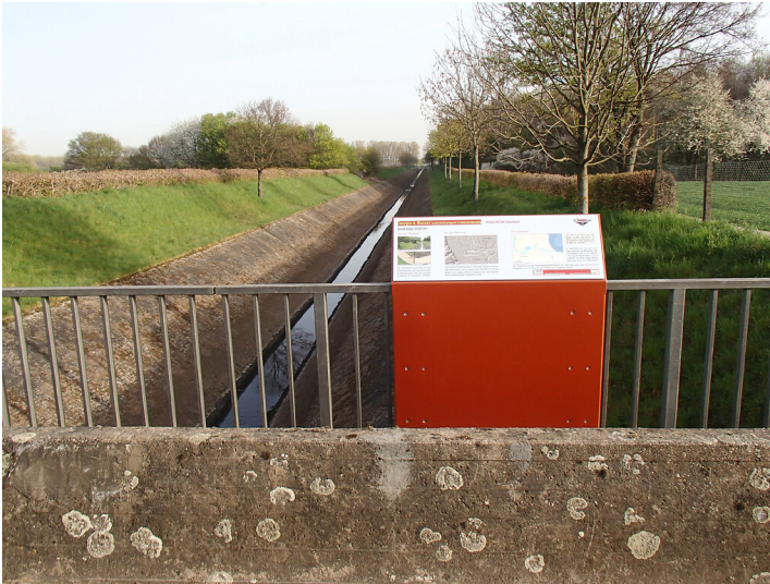
Erzählstation "Pletschbach" am Kölner Randkanal (2018)