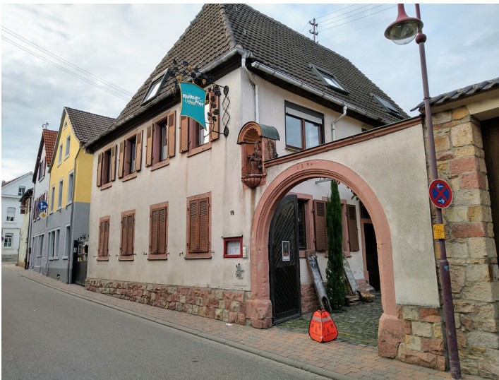
Hartmannstraße 14 Maikammer (2021)